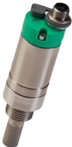
FA 410 监测除湿式干燥机的理想露点变送器

FA410 露点变送器为工业应用提供可靠和长期稳定的露点监测。这个新开发的传感器为高要求工业应用提供更好的信号和稳定性。这使得它成为在除湿式干燥机中进行露点测量的理想选择。